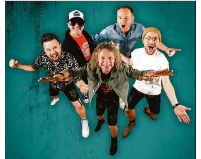
Die Troglauer gehören zu den erfolgreichsten deutschen Volks-Pop-Bands und werden mit ihrer mitreißenden Live-Show das Festzelt beim Hoffest in Römhild zum Beben bringen.

guter Laune und Thüringer Gastfreundschaft wartet auf seine Besucher.