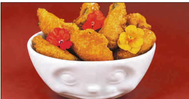
Goldbraun ausgebacken und herrlich knusprig: Die Tempura-Zucchini-Sticks sind ein unkomplizierter Genuss, der außen kross und innen wunderbar zart überzeugt.

Tempura-Zucchini-Sticks – außen herrlich kross, innen zart und saftig – der perfekte Snack für gemütliche Sommerabende