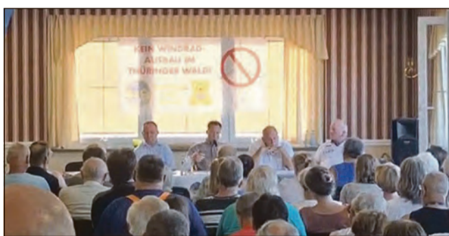
Rund 130 Besucher informierten sich in Effelder über die geplanten Windkraftvorhaben.