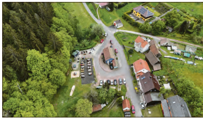
Der Dorfplatz in Fischbach wird Anfang Juli wieder zum Treffpunkt für ein fröhliches Festwochenende.

Hinter dem Fest steckt viel ehrenamtliches Engagement. Wochenlang planen und organisieren zahlreiche Helferinnen und Helfer das Programm, bauen das Festgelände auf,