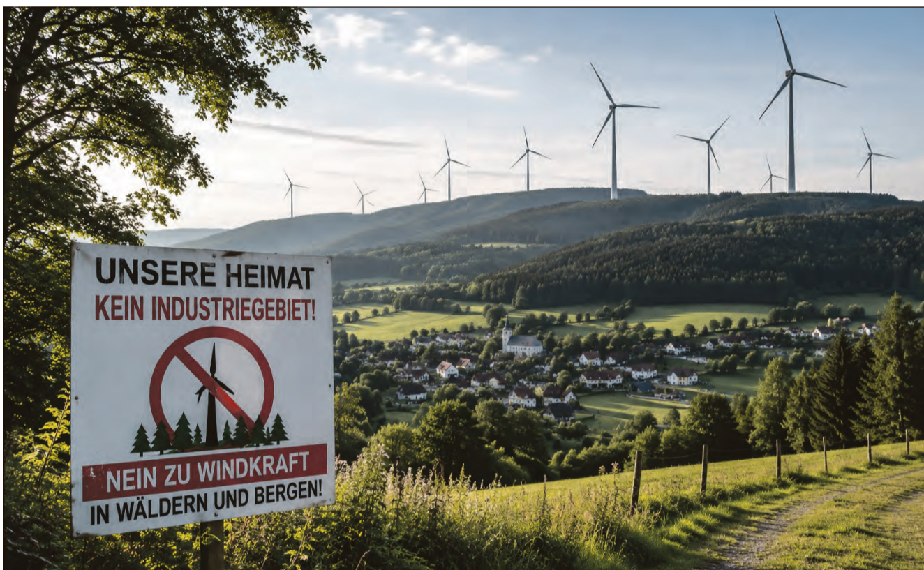
Der Widerstand gegen neue Windkraftanlagen in Südthüringen wächst. Besonders geplante Vorranggebiete in Wäldern, an prägenden Höhenzügen und nahe beliebter Erholungsräume sorgen für Kritik.

Jetzt zählt jede Stimme: Bürger können noch bis 20. Juli Stellungnahmen abgeben