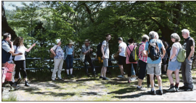
Teilnehmer der Pilgerwanderung am Stausee.

Nach einer Vorstellungsrunde stimmten die Teilnehmer gemeinsam das Lied „Geh aus, mein Herz, und suche Freud“ an und begaben sich anschließend auf den Weg rund um den Stausee bis zur Kirche. Damit wirklich alle teilnehmen konnten, wurde für Menschen mit eingeschränkter Mobilität ein Fahrdienst angeboten. In der