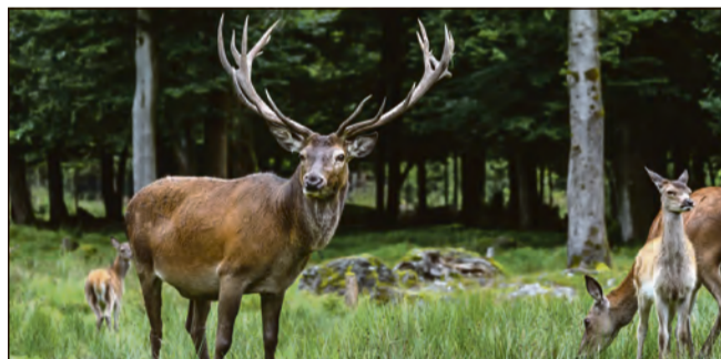
Rotwild steht im Mittelpunkt der aktuellen Debatte um besseren Lebensraumschutz.

AfD-Antrag zum besseren Schutz im Landtag gescheitert