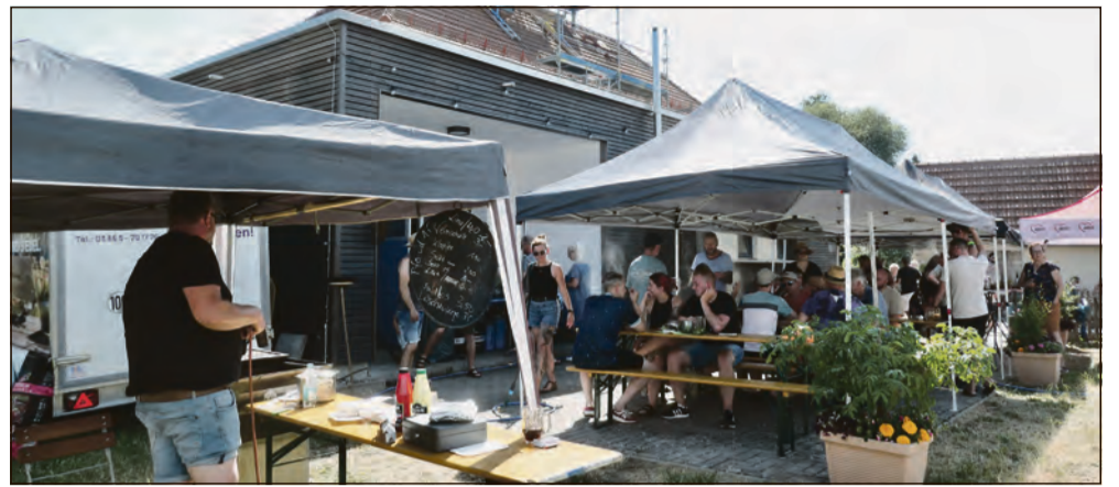
Zahlreiche Besucher ließen sich die gute Stimmung beim Backhausfest trotz der sommerlichen Hitze nicht entgehen.

Wallrabser ließen sich die Feierlaune nicht nehmen