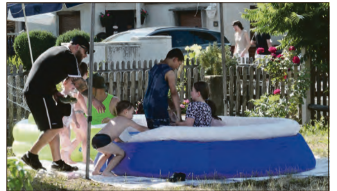
Planschbecken und Wasserspaß sorgten bei den kleinen Gästen für eine willkommene Abkühlung.

aus als in den Vorjahren. Dennoch herrschte den ganzen Tag über eine gesellige Atmosphäre und die Wallrabser bewiesen einmal mehr ihren starken Gemeinschaftssinn.