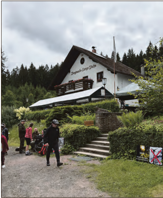
Die Bergbaude Lange Bahn – ein beliebtes Wanderziel, idyllisch gelegen im „Kleinen Thüringer Wald“.

Aber noch viel bedenklicher ist, dass dieses Wanderziel sowie der ganze Wald, welcher durch unsere Vorfahren in mühevoller Kleinarbeit angelegt und entwickelt wurde und