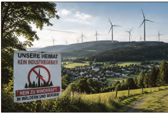
Der Widerstand gegen neue Windkraftanlagen in Südthüringen wächst. Besonders geplante Vorranggebiete in Wäldern, an prägenden Höhenzügen und nahe beliebter Erholungsräume sorgen für Kritik.

Wer sich beteiligen möchte, sollte deshalb prüfen: Liegt