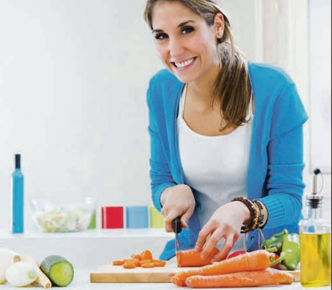
Eine pflanzenbetonte, basische Ernährung kann bei rheumatoider Arthritis als Begleittherapie die Beschwerden lindern.

Aus der Schmerzforschung: Basische Ernährung kann Beschwerden lindern