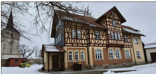
Blick auf die Kindertagesstätte Rieth.

Dennoch fanden beide Lösungsvorschläge keinen Zuspriech vom Bürgermeister und der Mehrheit der Stadträte. Einige wenige Stadträte haben sich sogar über das Engagement der Bürger amüsiert und sich beschwert, dass während einer Stadtratssitzung keiner der anwesenden Zuhörer „das Maul aufgekriegt hat“. An dieser Stelle sei gesagt, dass sich manch ein Stadratsmitglied mit der Hauptsatzung der Stadt Heldburg, §6 Abs. 4, auseinandersetzen sollte. Diese besagt: „...Einwohneranfragen, Anregungen oder Vorschläge zu Tagesordnungspunkten,