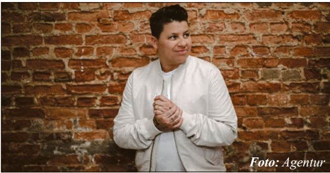
Kerstin Ott bringt am 14. August 2026 Schlager, Emotionen und Sommerfeeling ins Naturtheater Steinbach-Langenchbach.

Steinbach-Langenchbach. Ein Sommerabend voller Gefühle, Mitsingmomente und Gänsehaut: Am Freitag, dem 14. August 2026, lädt das Naturtheater Steinbach-Langenchbach ab 19.30 Uhr zum „SchlagerErlebnis – DIE SCHLAGERNACHT“ ein. Als Top-Act steht Kerstin Ott, eine der prägendsten Stimmen des deutschen Schlagers, auf der Bühne. Mit ihrem Durchbruchshit „Die immer lacht“ eroberte Kerstin Ott 2016 die Charts im Sturm – und blieb. Ehrliche Texte, tanzbare Melodien und Songs aus dem echten Leben machten sie zur festen Größe der Szene. Vier erfolgreiche