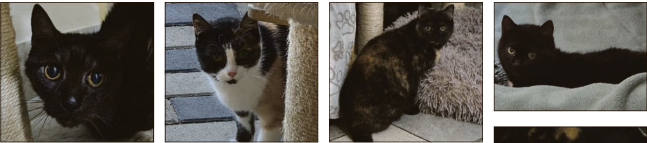
Die Katzendamen Abraxa, Amely, Angely, Antonia und Alma wünschen sich ein gemeinsames Zuhause auf Lebenszeit.

Hildburghausen. Fünf blühen sie in einer ruhigen zertrennlich und möchten nur blühen sie in einer ruhigen Umgebung auf. Die schüchternen Seniorinnen brauchen warme Plätze, sichere Verstecke und viel Ruhe – dafür schenken sie treue Gesellschaft und Liebe. Die fünf Damen sind unfonische Anmeldung unter 0151/59217424). Sie haben 15 Jahre auf Glück gewartet – jetzt verdienen sie ein letztes, behagliches Zuhause.