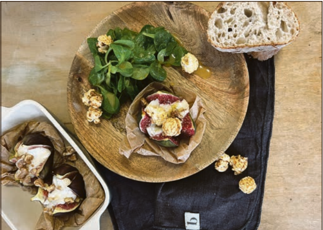
Warme Feigen, cremiger Ziegenkäse, Ahornsirup und knackiges Popcorn – ein winterlicher Genuss mit Knalleffekt.

Popcorn-Feigen mit Ziegenkäse – süß, herzhaft und überraschend anders