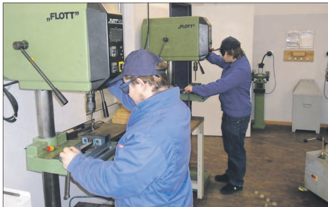
Das Bild zeigt Schüler der Berufsfachschule während der praktischen Tätigkeit in den modern eingerichteten Werkstätten des Berufsschulzentrums.

Berufsfachschule ebnet den Weg zum Realschulabschluss