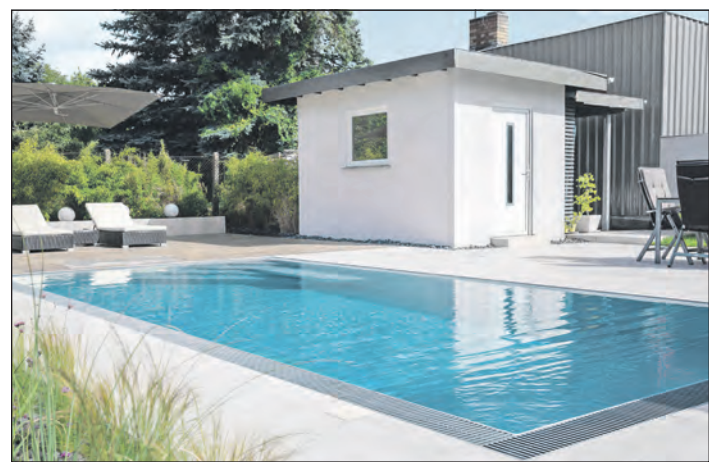
Wenig Aufwand und überschaubare Kosten: Fertigpools werden bereits vollständig montiert, verrohrt und verkabelt angeliefert.

Wer seinen Pool jetzt plant, kann im nächsten Jahr die Abkühlung genießen