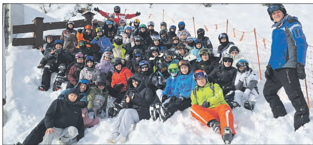
Gruppenfoto mit allen Teilnehmern beim diesjährigen Skilager in Südtirol.