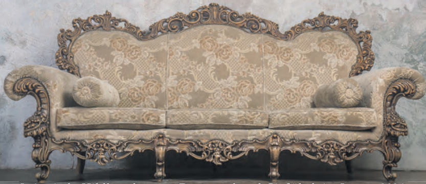
Leimrieth, Hildburghausen, Dortmund und Gießübel, im Januar 2024

Aus diesem Grund bitten wir von Blumengebinden abzusehen.