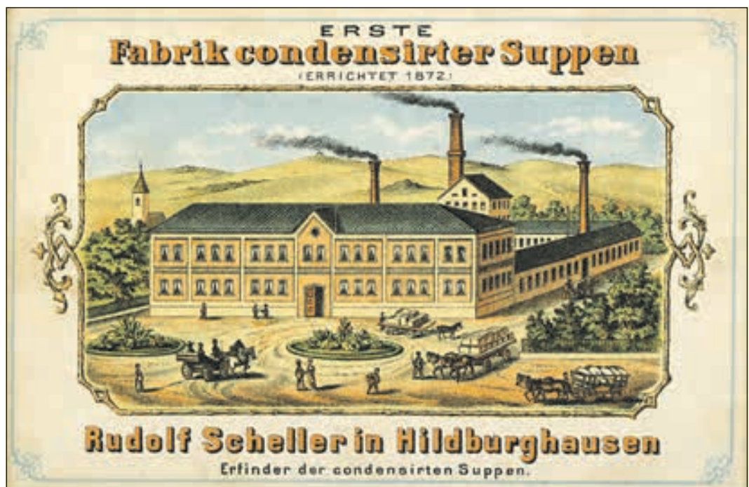
Werbekarte der „Ersten Fabrik condensirter Suppen von Rudolf Scheller, Hildburghausen“, um 1890.

Der Eintritt beträgt wie üblich 3 Euro. Karten können im Vorverkauf auch im Stadtmuseum, Apothekegasse 11 erworben werden.