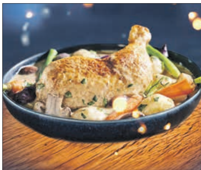
Hähnchen in Weißweinsauce.