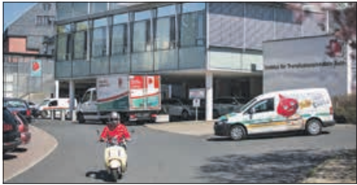
Im 60sten Jahr der Blutspende Suhl sind zahlreiche Aktionen für die Spenderinnen und Spender geplant.

Suhl. Blut spenden heißt - Leben retten. Unter diesem Motto ist der Suhler Blutspendedienst als mittlerweile der größte kommunaler Blutspendedienst in Deutschland am Mittwoch, dem 13. Dezember 2023 exakt 60 Jahre erfolgreich tätig.