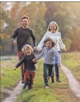
Bei der Frage nach den konkreten Dingen, für die man dankbar ist, steht die Familie für die Menschen in Deutschland an der Spitze, knapp vor der Gesundheit. Das ergab eine aktuelle Studie.

(dj-d-k). Bei einer Forsa-Umfrage im Auftrag der Neuapostolischen Kirche erklärten 97 Prozent der Befragten, dass es Dinge gibt, für die sie dankbar sind - und das trotz oder sogar wegen der vielen aktuellen Krisen. Bei der Frage nach den konkreten Dingen, für die man dankbar ist, steht die Familie knapp vor der Gesundheit an der Spitze.