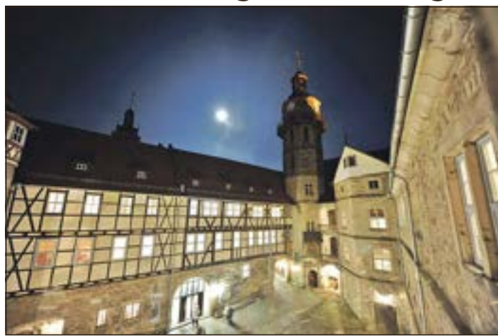
Blick in den abendlich beleuchteten Burghof der Bertholdsburg in Schleusingen.

Schleusingen. Das Naturhistorische Museum Schloss Bertholdsburg Schleusingen lädt mit Unterstützung seines Freundeskreises am Samstag, dem 18. November 2023 in der Zeit von 18 bis 23 Uhr zur 16. Kultur- und Museumsnacht ein. Eine spannende Entdeckungstour mit verschiedenen Angeboten für Kinder und Erwachsene ist dort in nächtlicher Atmosphäre zu erleben.