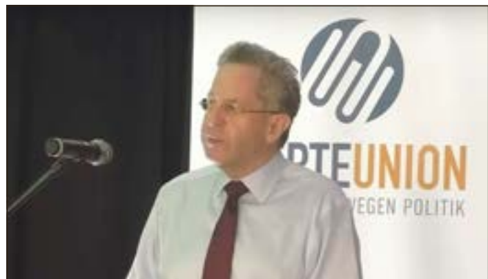
Eine Antwort aus dem Konrad-Adenauer-Haus wird bis zum 14. November erwartet.

(aw). Die konservative Bewegung innerhalb der CDU wird im Ton schärfer. Nach dem gescheiterten Parteiausschlussverfahren gegen ihren Vorsitzenden Dr. Maaßen geht die WerteUnion in die Offensive.