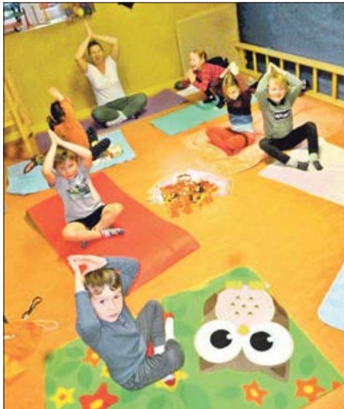
Sichtlich Spaß hatten die kleinen Pustebblumen beim „Kinder-Yoga“.

Westhausen. Die Kinder der Diakonie-Kindertagesstätte „Pustebblume“ in Westhausen finden sich seit kurzem einmal in der Woche zum „Kinder-Yoga“ mit Freiberuflerin Stephanie Brehm im hauseigenen Sportraum zusammen. Aufgeteilt in zwei Gruppen üben sich insgesamt 16 Kinder in der aus Indien stammenden Lehre, die sich wohltuend auf Körper und Geist auswirken soll.