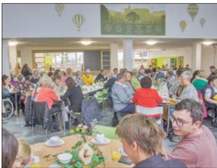
Blick in das festlich geschmückte Atrium der Regelschule zur Eröffnungsveranstaltung „50 Jahre Schule Heldburg“.