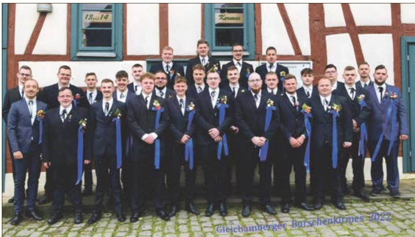
Gleichamberger Burschenkirmes 2022

Die Kirmesgesellschaft und die Gewerbetreibenden wünschen allen Besuchern der Kirmes viel Spaß in Gleichamberg.