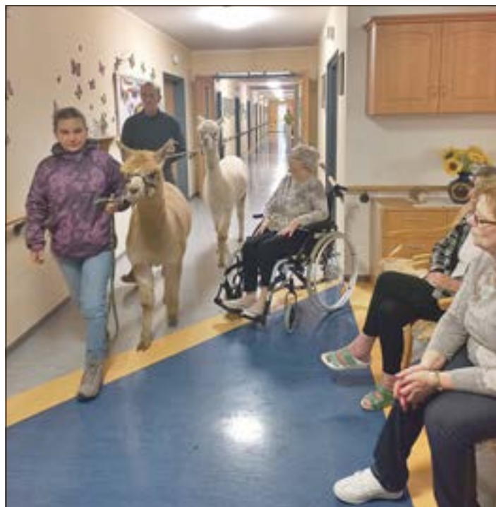
Große Freude bescherte der Besuch der Alpakas Elvis und Nacho den Bewohnern im Seniorenzentrum „Hildburghäuser Land“.