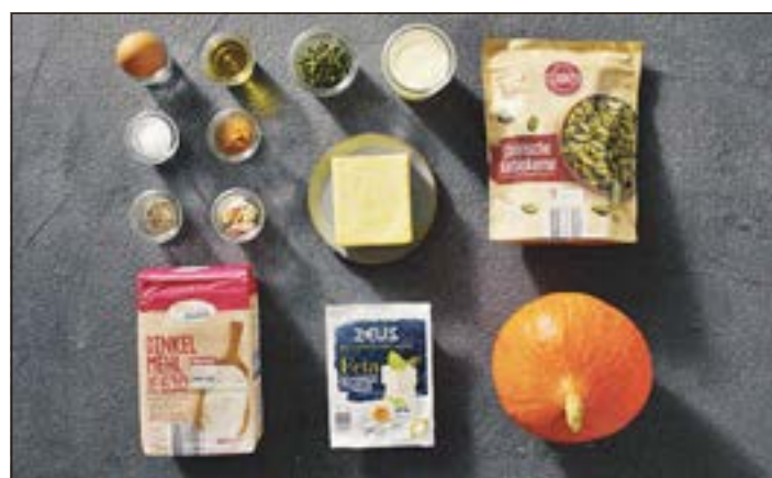
Zutaten für Kürbis-Törtchen mit Salbei und Feta.