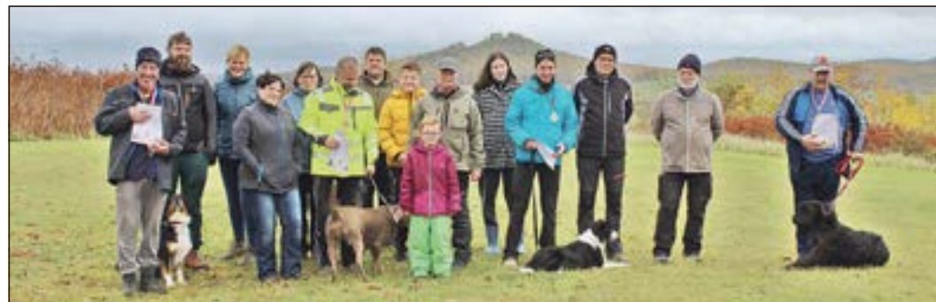
Die erfolgreichen Teams der Herbstprüfung.