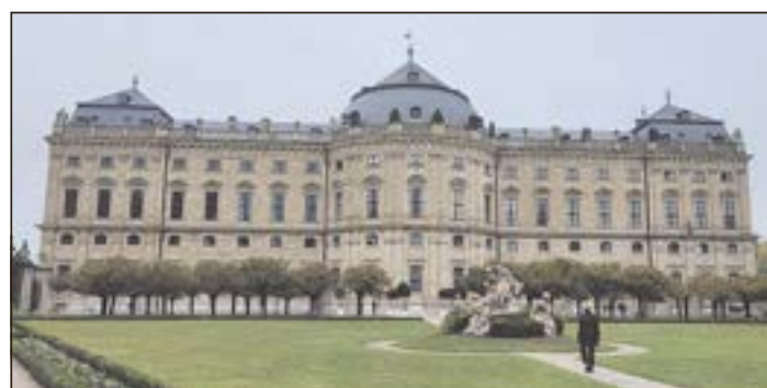
Die Residenz in Würzburg.