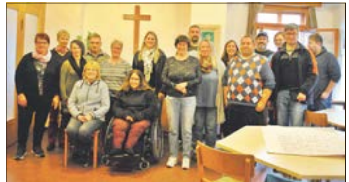
Gruppenfoto aller Teilnehmer der Fortbildung.