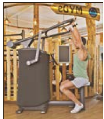
eGYM ganz Neu. Foto: Fit for Life

Anmeldungen für das Rückenprojekt unter Tel. 03685/703644 (www.fit-for-life.com) Anmeldeschluss ist der 18. November 2023.